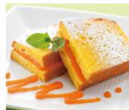
特別デザートの日