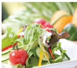
有機野菜のサラダバー